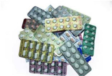
写真1 PTP 包装シート (イメージ) 6

PTP 包装シートは誤飲事故を防ぐために 1錠ずつ切り離せないような構造になっていますが、「切り離れた薬を飲んだ」という事例も見られます。