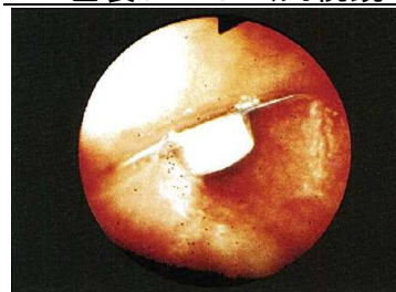
写真2 食道に斜めに突き刺さった PTP 包装シート (内視鏡写真) 7