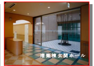
増築棟玄関ホール