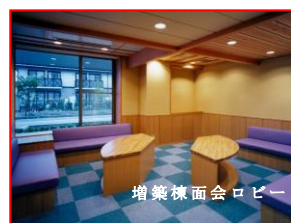
増築棟面会ロビー