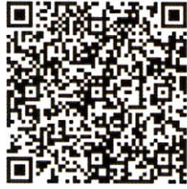
Web参加申込 2次元コード アクセス