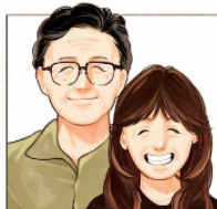
岐阜県の認知症当事者の方とご家族