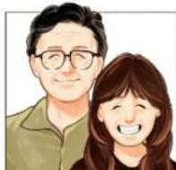
岐阜県の認知症当事者の方とご家族